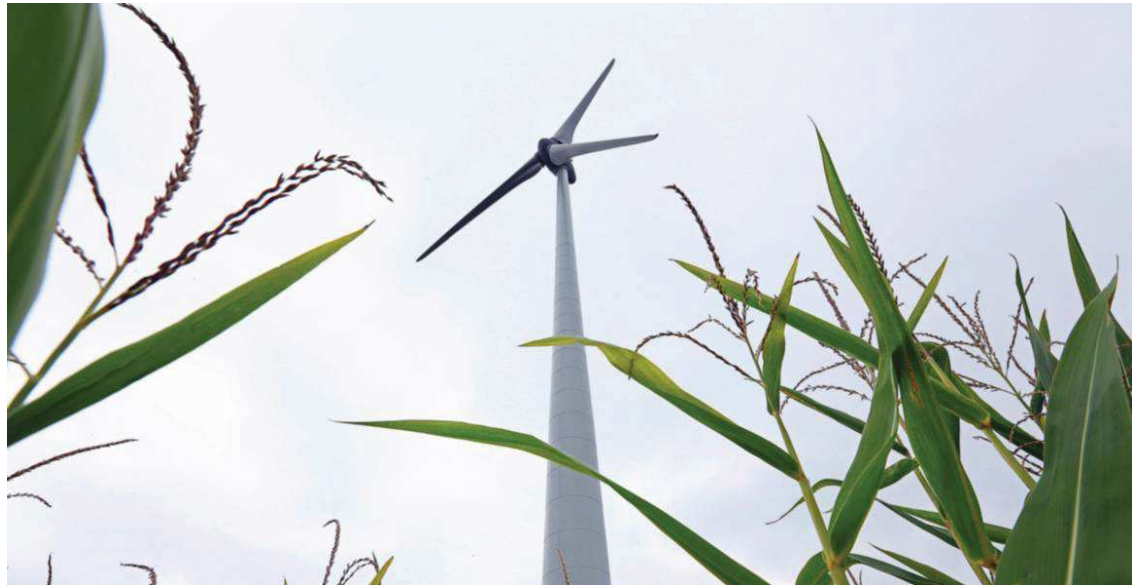
Des projets ayant un fort impact environnemental, comme les éoliennes terrestres de plus de douze mètres, pourront entrer dans le cadre de cette expérimentation.

Simplification administrative ou atteinte à la démocratie participative ? L'Exécutif vient de publier un décret permettant, dans certains cas, de remplacer l'enquête publique par une consultation du public sur internet. Le dispositif sera testé en Bretagne et pourra concerner des projets à fort impact environnemental.